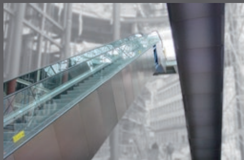
Uso decorativo en el diseño