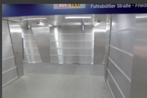
Antivandálico en espacios abiertos al público