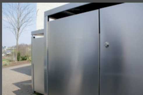
Diseño libre de objetos